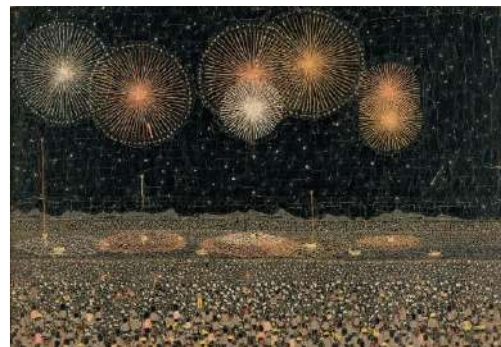
《長岡の花火》貼絵/1950(昭和25)年 ©Kiyoshi Yamashita / STEPeast 2025

放浪の天才画家として知られる山下清(1922-1971)の生誕100年を記念して、幼少期の鉛筆画をはじめ、晩年の油彩画、水彩画、ペン画、陶磁器など焼く190点の作品と旅先で持参したリュックサックや浴衣などの関連資料を展示します。代表作の「長岡の花火」をはじめとした貼り絵を中心に展示します。テレビドラマや映画で紹介されたイメージとは一味違うアーティスト、山下清の姿をぜひご覧ください。