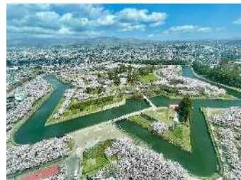
桜の名所五稜郭公園 (自由散策)