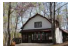
和寒塩狩峠記念館