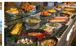
「Hokkaido Sky Terrace MINORI」

大雪山連邦と旭川市内を見渡せる最上階レストラン。 旬の食材を使用したランチビュッフェが人気です。