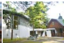
三浦綾子記念文学館