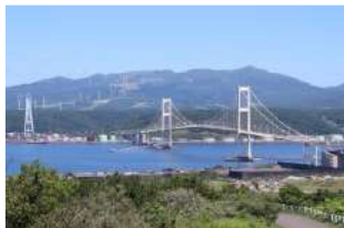
室蘭祝津展望台からの白鳥大橋