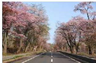
登別市桜並木【8kmのエゾヤマザクラ】

*○印は下車観光 ●印は入場観光 悪天候及び交通機関等の諸事情によりスケジュールが変更となる場合がございます。凡例 =貸切バス移動 *桜の開花状況に関しましては気象条件によりご満足いただけない場合もあります。