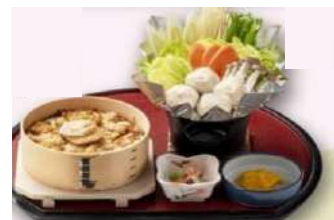
ほたておこわ かみつみれ鍋御膳