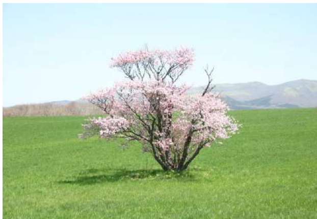
室蘭崎守の一本桜(車窓からの見学)