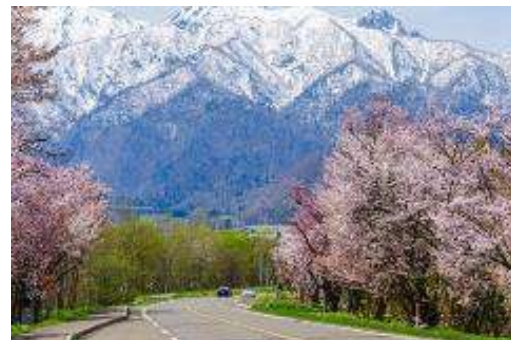
東大演習林樹木園 桜並木