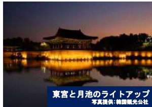
東宮と月池のライトアップ

韓国伝統の仮面・タルとその仮面を用いる踊る仮面舞・タルチュムをテーマにした楽しいお祭りです。世界遺産・安東河回村に伝承されている「河回別神グッ仮面劇」をはじめ、韓国全国の様々な仮面舞や海外の仮面舞などさまざまな公演が行われます。