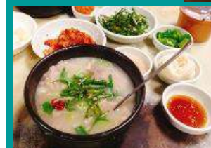
釜山名物 テジクッパ(豚肉スープご飯) (イメツ)