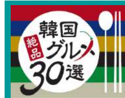
韓国絶品 グルメ 30選