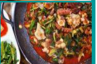
釜山名物 ナクチポックン(豚肉)

韓国絶品グルメ30選とは、日本の旅行業界のプロが選んだ韓国のご当地グルメです。名物料理を本場で楽しみたい。