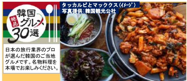
タッカルビとマックス(イメージ)

日本の旅行業界のプロが選んだ韓国のご当地グルメです。名物料理を本場でお楽しみください。