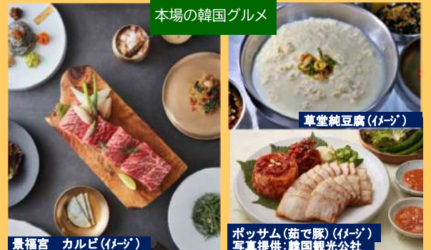
草堂純豆腐(イメージ)